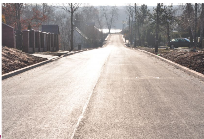
ul. Żytnia po przebudowie

Łączny koszt poniesiony w 2016 r. inwestycji to ok. 4 mln 212 tys. zł, uzyskane dofinansowanie w ramach programu wieloletniego pn. „Program Rozwoju Gminnej i Powiatowej Infrastruktury Drogowej na lata 2016-2019” ok. 1 mln 784 tys. zł.