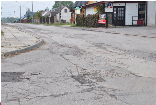
ul. Południowa przed przebudową