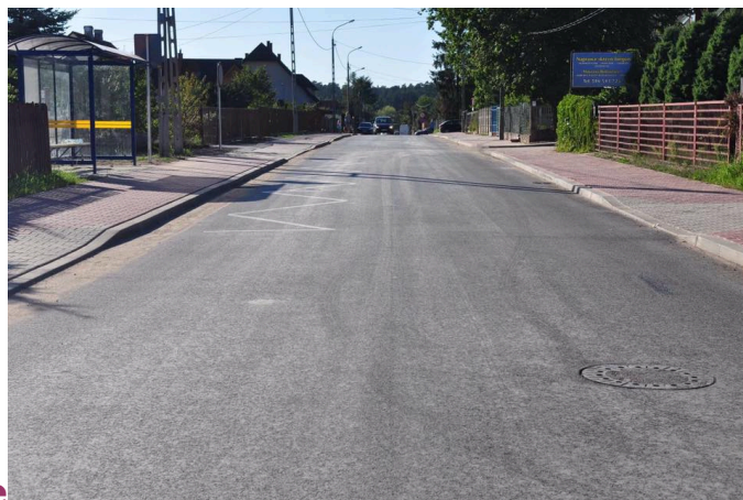
Południowa po przebudowie

5. Na początku grudnia 2016 r. zakończyła się inwestycja pn. "Przebudowa i budowa ulic w południowej części miasta z kompleksowym rozwiązaniem odwodnienia" .