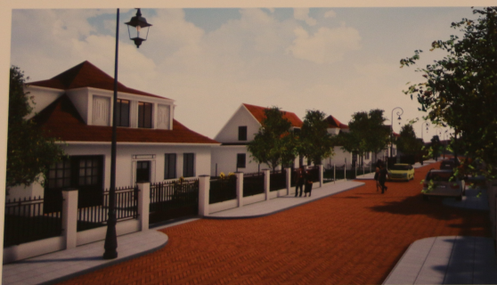
Projektowana zabudowa jednorodzinna wolnostojąca