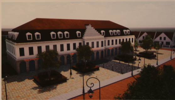
Projektowany plac miejski oraz Dom Kultury