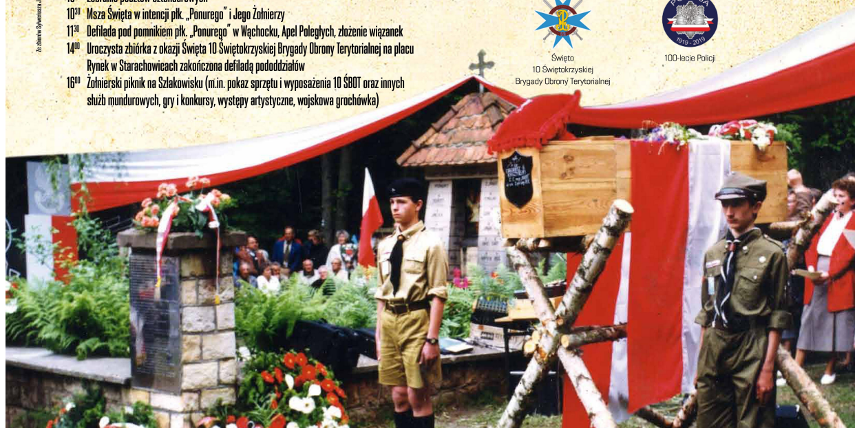
Wspierca organizacyjna i finansowa w organizacji uroczystości