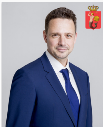
Rafał Trzaskowski Warszawa

Popularność prezydentów polskich miast w mediach społecznościowych na tle liczby mieszkańców miasta, którym zarządzają