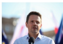
Rafał Trzaskowski prezydent Warszawy