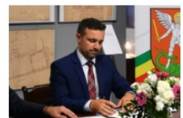
Michał Litwiniuk prezydent Białej Podlaskiej