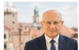
Krzysztof Żuk prezydent Lublina