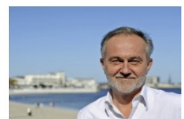
Wojciech Szczurek prezydent Gdyni

- Bardzo miłe informacje w niedzielny wieczór. Zostałem nominowany do