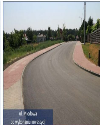
ul. Miodowa po wykonaniu inwestycji