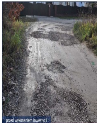
przed wykonaniem inwestycji

jezdnię asfaltową - koszt: 533 010,26 zł, kanalizację deszczową - koszt: 83 425,11 zł