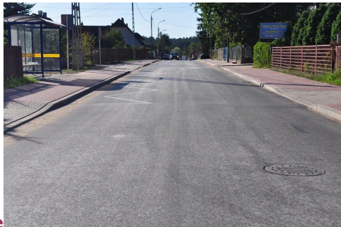
Południowa po przebudowie