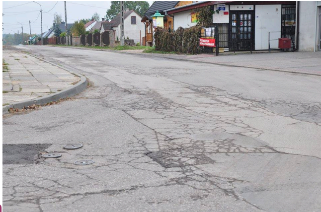
ul. Południowa przed przebudową